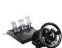
Thrustmaster T-GT 高階方向盤控制器