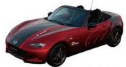
2018年式 MAZDA MX-5跑車 (魂動紅)