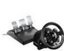
Thrustmaster T-GT 高階方向盤控制器