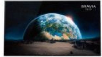
BRAVIA 4K HDR 高畫質OLED電視 KD-65A1