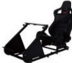
APIGA AP1 專業賽車座椅