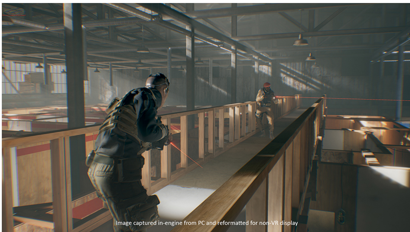
Image captured in-engine from PC and reformatted for non-VR display

Il titolo che abbiamo per le mani è immediatamente entusiasmante, si viene subito colpiti dalla perfezione grafica, dalla ricchezza di dettagli e dal realismo immersivo. Sfortunatamente, un paio di dettagli non da poco fanno scendere la valutazione globale e, se non fosse per queste piccole pecche, il gioco avrebbe tranquillamente potuto ambire ad un 10 pieno.