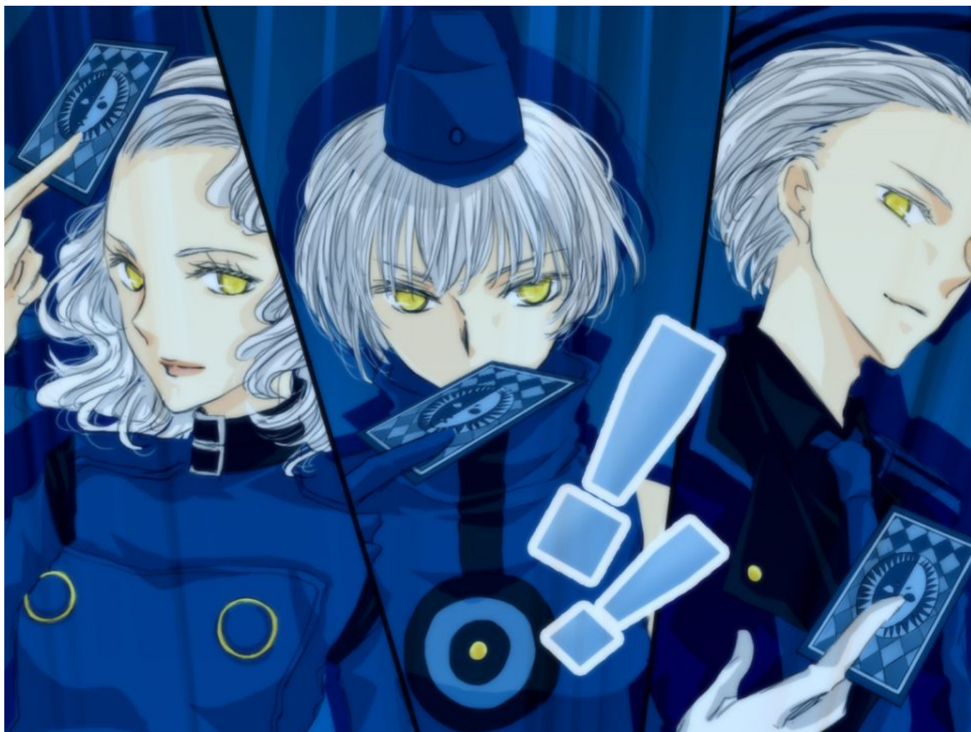
(Nell'immagine, a sinistra Margaret di Persona 4, al centro Elizabeth di Persona 3 e a destra Theo di Persona 3)