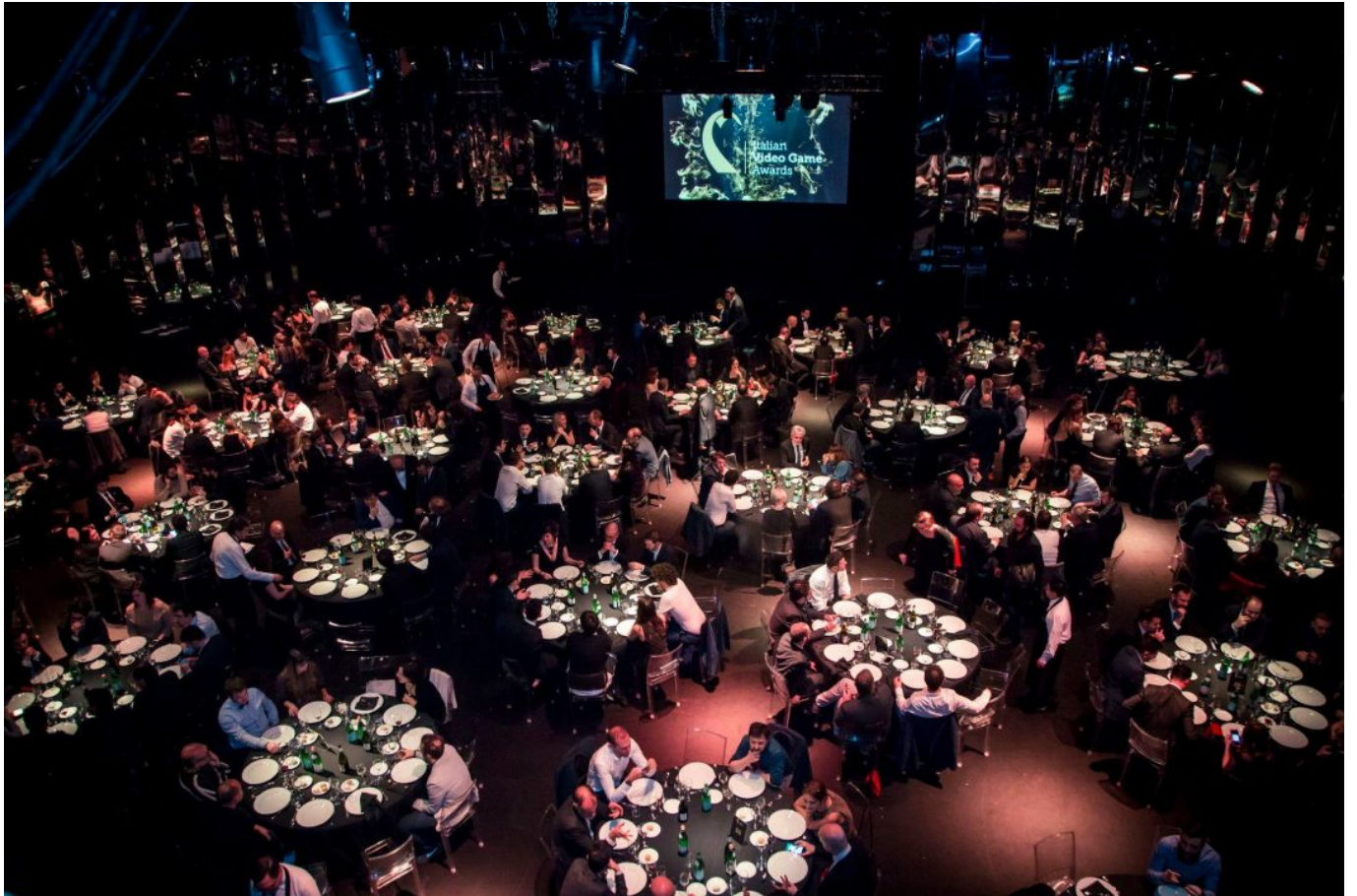
Game of the Year: The Legend of Zelda: Breath of the Wild