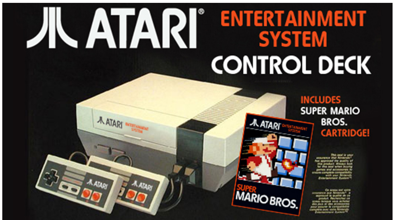
(La curiosa immaginazione di un utente su internet)

A ogni modo, il mancato accordo fra le due compagnie è stato decisamente un bene per la compagnia giapponese: Nintendo , col tempo, ha potuto studiare meglio il mercato americano e nel 1985 ha rilasciato il suo NES con risultati strabilianti. La chiave per entrare sul mercato fu trovata con un semplice stratagemma: passare dai negozi di elettronica a quelli di giocattoli. Ma questa è una storia a parte, che racconteremo magari un'altra volta. Per ricordare però il successo del NES basta guardare i numeri: la console giapponese raggiunse il milione (e cento) di unità in un solo anno, l' Atari 7800 in un arco di tempo che va dal 1986 al 1988. Atari invece rimase sola e, nonostante una buona linea di computer e console hit or miss , non riuscì più a conquistare la fiducia dei consumatori, non la stessa dei tempi dell' Atari 2600 . Probabilmente l'accordo non avrebbe beneficiato nessuno dei due.