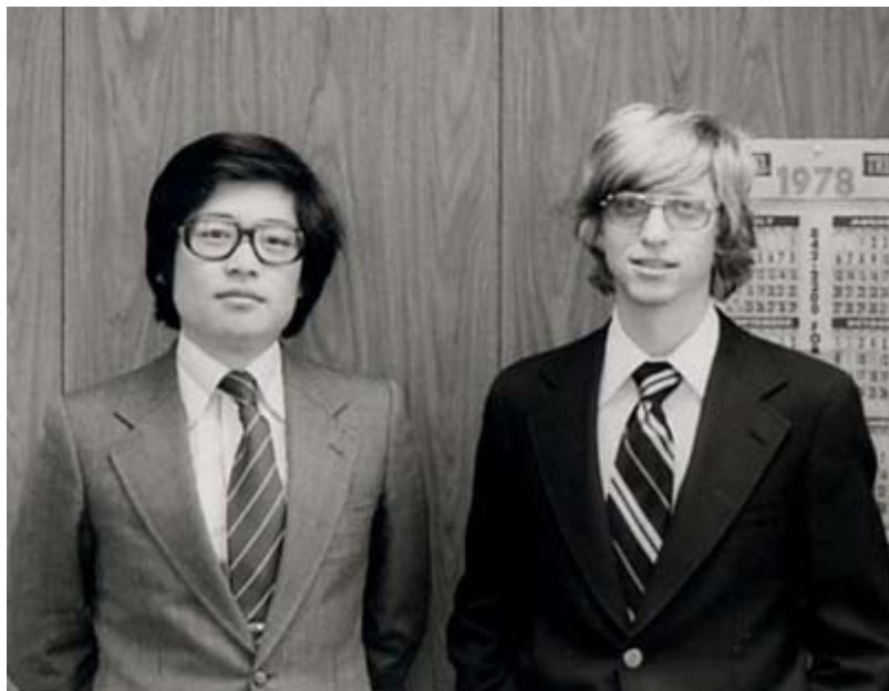
(Kazuhiko Nishi e Bill Gates)