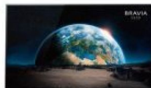
BRAVIA 4K HDR 高畫質OLED電視 KD-65A1