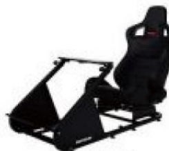
APIGA AP1 專業賽車座椅