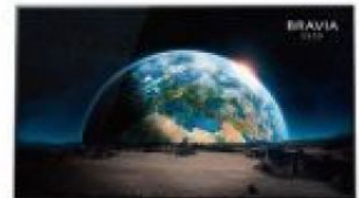
BRAVIA 4K HDR 高畫質OLED電視 KD-65A1