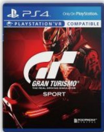
Gran Turismo Sport (中英文合版)