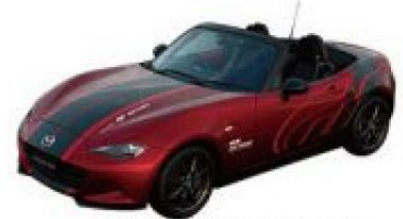
2018年式 MAZDA MX-5跑車 (魂動紅)