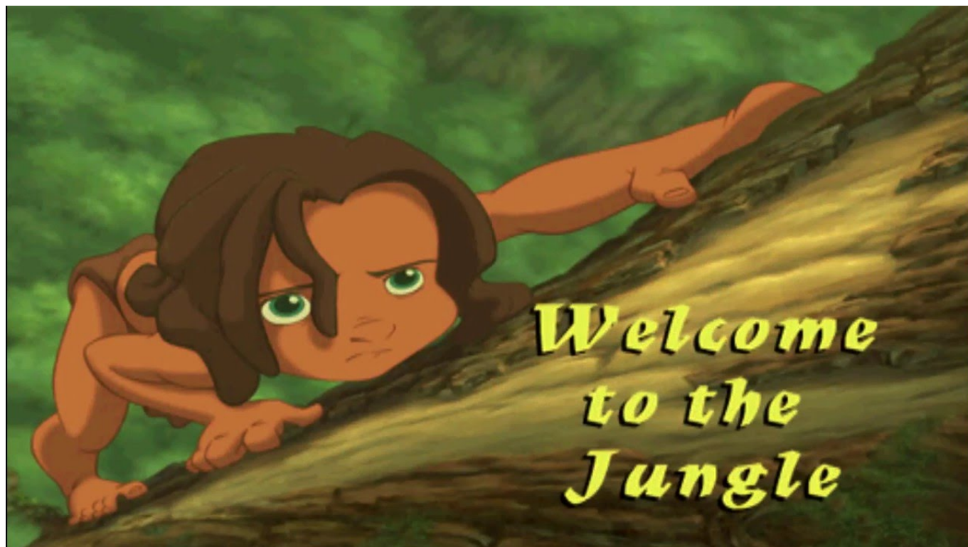
Screenshot preso da Disney's Tarzan per PlayStation, uscito nel 1999.

Anche Electronic Arts approfittò delle pellicole più famose uscite in quegli anni, portando su console e PC l'intera saga di Harry Potter . E non scordiamoci della trilogia di Spider Man , trasformata in videogioco grazie ai molteplici titoli di Activision .