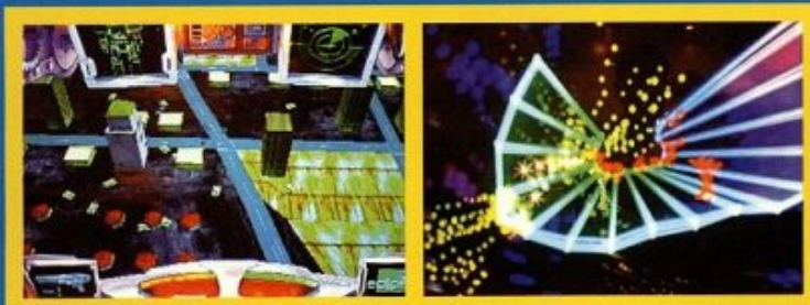
These visuals don't necessarily compete graphically with Dreamcast, but they're not supposed to. They are basically programmer demos designed to show off different engines and techniques

If the software is there, if the cost isn't prohibitively high, and if the hardware manufacturers stand behind the system for more than one or two hardware iterations, Project X could succeed. But that's a lot of "ifs," and the only thing that's certain right now is that Project X is a very, very neat idea.